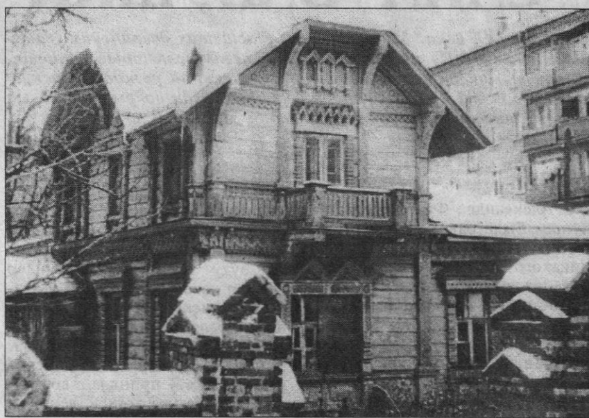
Дом Хвостова. Незадолго до пожара