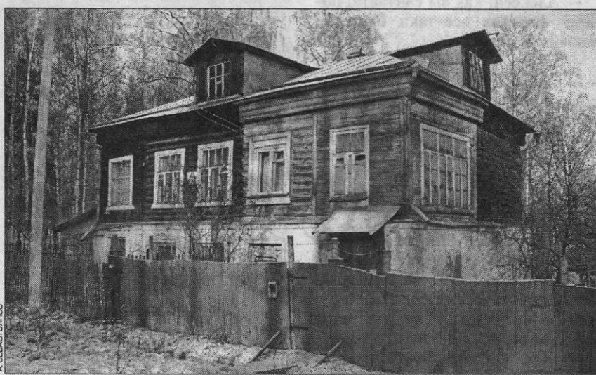
Краснокувка. Полевая улица. Дом, где жил и умер В. В. Розанов (современный вид).

Лидия ГИРЛИНА, председатель краеведческого клуба «Хронос»